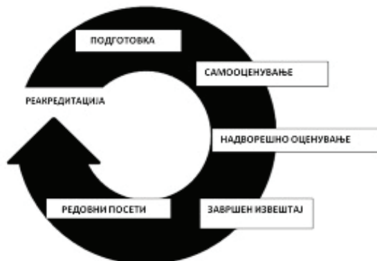
Слика 2. Процес на акредитација и реакредитација

Доколку со актот за основање на здравствената установа (болницата) некои здравствени услуги не се спроведуваат и некои служби се отсутни, здравствената установа поднесува до Агенцијата барање за изземање од поединечни стандарди со детално образложение и докази што го поткрепуваат барањето уште пред да поднесе апликација за надворешно оценување. По разгледувањето на ваквото барање, Агенцијата го одобрува или го одбива барањето и врз основа на оваа одлука во понатамошната фаза го планира времетраењето на надворешното оценување.