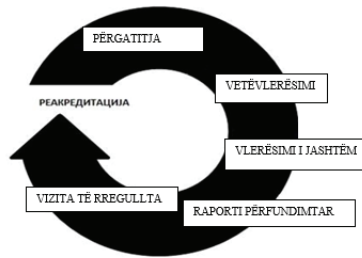
Figura 2. Procesi i akreditimit dhe riakreditimi

Nëse me aktin e themelimit të një institucioni shëndetësor (spitali) disa shërbime shëndetësore nuk kryhen dhe disa shërbime mungojnë, institucioni shëndetësor para se të paraqesë kërkesën për vlerësim të jashtëm, i paraqet Agjencisë kërkesën për lirim nga standardet individuale me arsyetimin e detajuar dhe provat që mbështesin kërkesën. Pas shqyrtimit të kërkesës së tillë, agjencia miraton ose refuzon kërkesën dhe në bazë të këtij vendimi, planifikon në një fazë të mëtejshme kohëzgjatjen e vlerësimit të jashtëm.